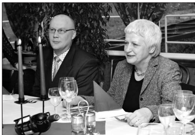
poradci Evropské komise vyslaní na UPa direktoriátem pro vzdělávání a kulturu

Z absolvovaných diskuzí a závěrečné zprávy, kterou univerzita obdržela po jejím zpracování jako zpětnou vazbu a doporučení pro vedení dalších kroků a která je určena také pro příslušný direktoriát Evropské komise a skupinu zabývající se implementací ECTS a dodatku k diplomu (Diploma Supplement) v Evropě, vyplynulo např., že veškeré základní studijní informace, studijní předpisy, studijní předpoklady a informace o přijímání do studijních programů, informace o vlastních studijních programech a oborech, jejich obsahu i cíli, tj. o vědomostním profilu absolventa, studijní plány, harmonogram akademického roku atd. (tzv. informační balíček včetně katalogu kurzů), a to v kompletní podobě podle doporučení EK, musí být jak studentům českým, tak zahraničním, ale i široké odborné veřejnosti k dispozici nejen v předepsané struktuře v českém jazyce, ale i v anglickém, a vše zveřejněno a uživatelsky vlídně dostupné na webových stránkách a v informačních studijních systémech univerzity;