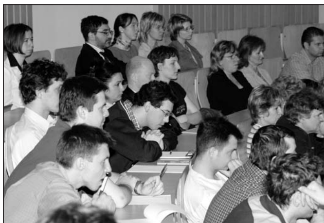
závěr intenzivních diskuzí a jednání s poradci EK proběhl v pátek 5. 5. v aule

skutečnou situaci a zkušenosti se zavádění jednotného kreditního systému na konkrétní fakultě, velice detailně vysvětlovali podmínky implementace a využívání ECTS a aplikace DS v souvislosti s mezinárodními standardy ve vzdělávacím procesu a mobilitami v rámci evropského vysokoškolského prostoru, doporučili potřebné úpravy a změny, které by měly fakulta a univerzita učinit.