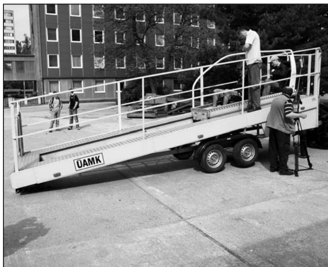
trenažer nárazu na vnitřním nádvoří dopravní fakulty