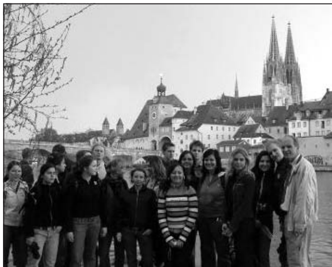
toto určitě nejsou poslední pardubičtí studenti v Řezně nad Dunajem

Přes Kamenný most! Div světa ve střední Evropě ve středověku. Vzor pro náš Juditin i Karlův most. A už jsme stáli na