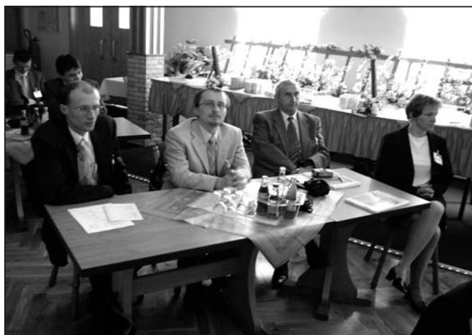
delegace z dopravní fakulty na jednání v odborných sekcích