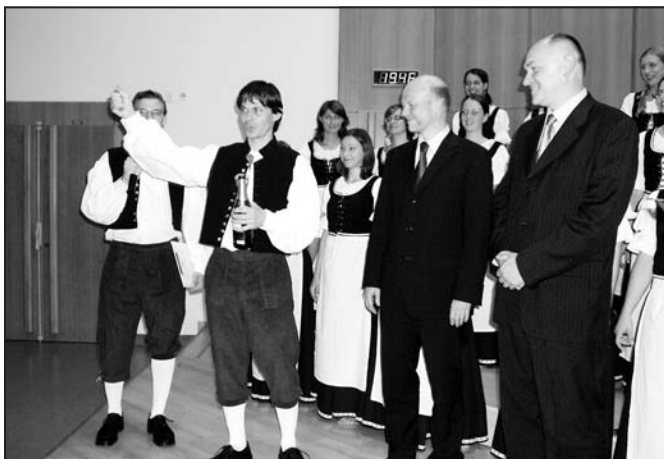
Vysokoškolský umělecký soubor křtí nové CD za přítomnosti rektora UPa a ředitele Meterostavu, a.s. obl. Pce - HK, partnerů VUS