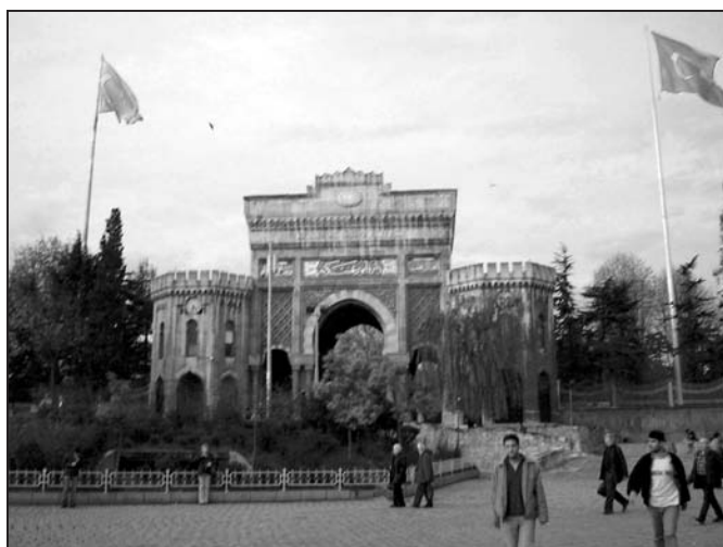
pohled na Univerzitu Istanbul