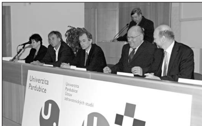
ze zahájení I. pardubických ošetrovateľských dní v univerzitní aule