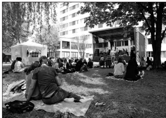
koncerty pod širým nebem mezi kolejemi se konají již od r. 1979