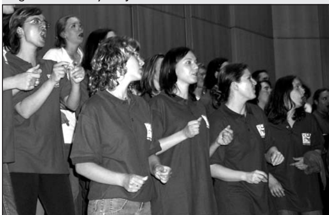
vlastním zpěvem rozpohybovaní VUSáci a jejich hosté v hudebním soustředění