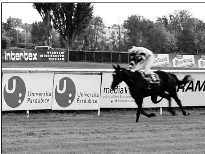
vítězný kůň dostihu Ceny Univerzity Pardubice v cílové rovině