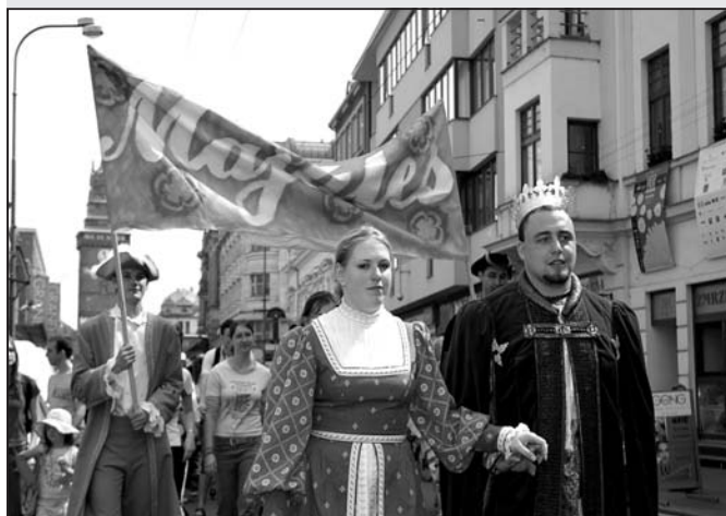
královská družina na cestě z centra města na koleje, tentokrát pěšky