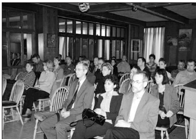
z jednání kalorimetrického semináře konaného ve slovenském Zvolenu

Ve dnech 22. – 26. května pořádaly Společná laboratoř chemie pevných látek Univerzity Pardubice a ÚMCH AV ČR, Katedra obecné a anorganické chemie Fakulty chemicko-technologické Univerzity Pardubice a Odborná skupina chemické termodynamiky ČSCH společně s Ústavem ekologie lesa SAV ve Zvolenu 28. mezinárodní slovenský a český kalorimetrický seminář.