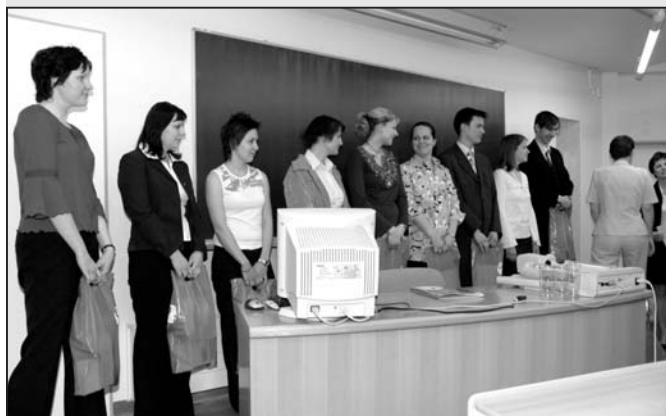
na I. celostátní studentské vědecké konferenci bakalářského studijního programu Ošetrovateľství bylo prezentováno 9 prací

dentky, jež se umístily na prvních třech místech 3. studentské vědecké konference Ústavu zdravotnických studií, která se konala v březnu tohoto roku. Dalšími účastníky byli tři studenti Jihočeské univerzity v Českých Budějovicích, jedna studentka Univerzity Palackého v Olomouci a dvě studentky Masarykovy univerzity v Brně.