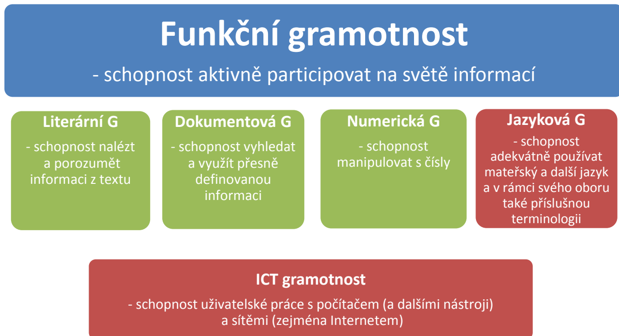
Obrázek 1 - Model funkční gramotnosti obohacený o ICT gramotnost 4

Obrázky se číslují jednotně od začátku do konce práce. Titulek se umísťuje vždy pod obrázek. Obrázek je zároveň uveden v úvodní části práce v Seznamu ilustrací a tabulek. Pro odkazování je v tomto konkrétním příkladu použita metoda průběžných poznámek.