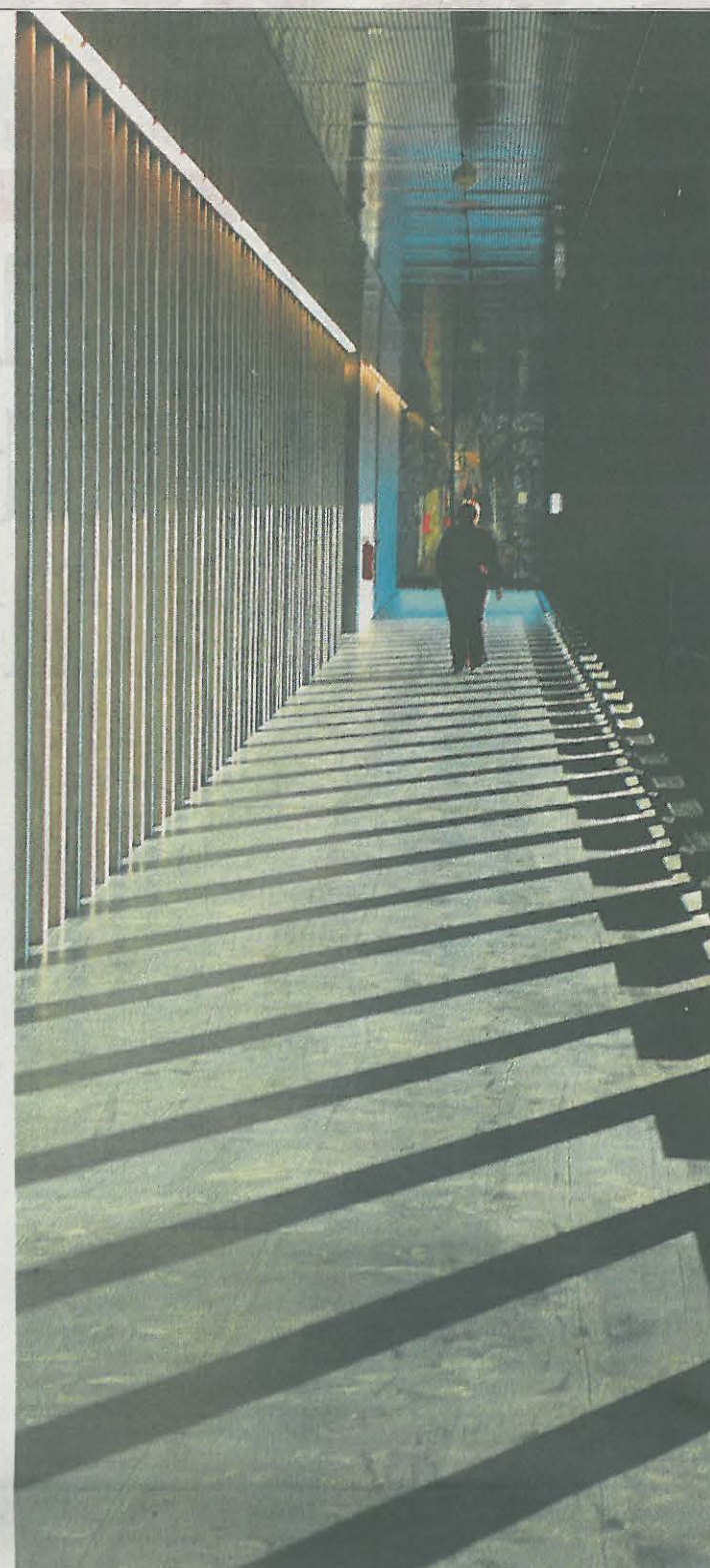
Moderní zázemí Před šesti lety pardubická univerzita otevřela nový areál fakulty chemicko-technologické.

„Podmínky, které měla vysoká škola na svém začátku před 65 lety a nyní, jsou nesrovnatelné. Univerzita Pardubice se stala moderní a konsolidovanou institucí, kterou opouští vysoce kvalifikovaní odborníci,“ řekl Ludwig.