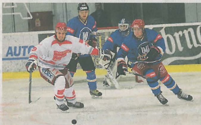
Brněnské školy Ani na ledě nebyla nuda. V souboji Masarykovy univerzity s Vysokým učením technickým došlo i na klasickou bitku.