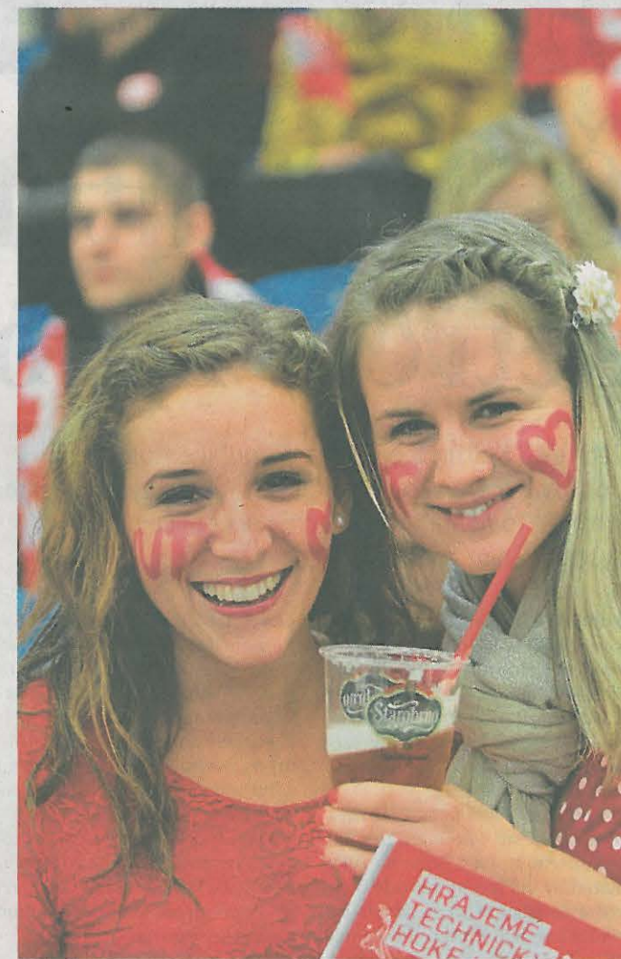
Fanynky Takto loni v říjnu fandily VUT na hokejovém Souboji univerzit v brněnské hale Rondo, kam dorazilo přes sedm tisíc diváků.

Ale na druhou stranu, stále půjde hlavně o sport. A brněnská zku-