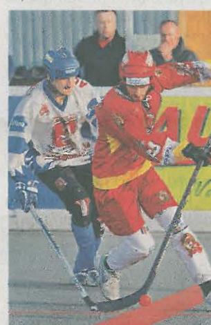
Bitva Oba tradiční rivalové na sebe narazí v Polabinách dnes večer.

měnili kádr, ale čekal jsem, že budou hrát střed tabulky. Doufám, že se nechytí na nás,“ přeje si kouč.