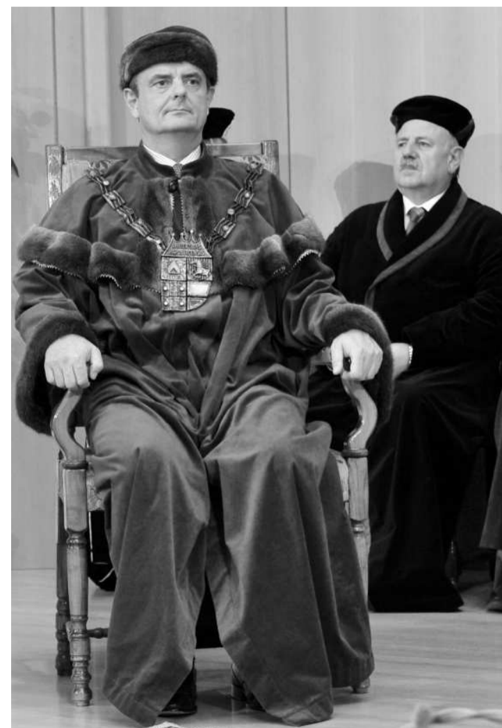
K FUNKCI rektora patří i účast na akademických obědích, zejména promócích nových absolventů univerzity.