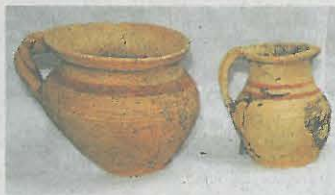
Nálezy Keramika ze 14. století.

Nádoby byly s velkou pravděpodobností poškozeny při samotném výpalu. Na různých částech nádob také došlo k odprýsknutí keramického těsta. „Takové zboží bylo ne-