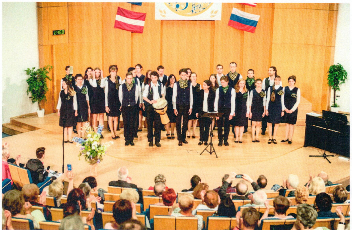
AULA PARDUBICKÉ univerzity hostila soutěžní klání mezinárodního festivalu pěveckých sborů IFAS 2016. Zúčastnilo se jej na 500 pěvců z celého světa.

V řadě koncertů a pěveckých vystoupení nejen v Pardubicích zazněla přehlídka světových písní. Soutěžní části dominovali novozélandští zpěváci, neztratily se ale ani domácí