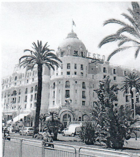
MĚSTO NICE se stalo terčem útoku.